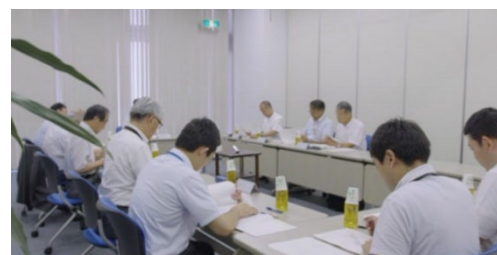
写真2 委員会の様子