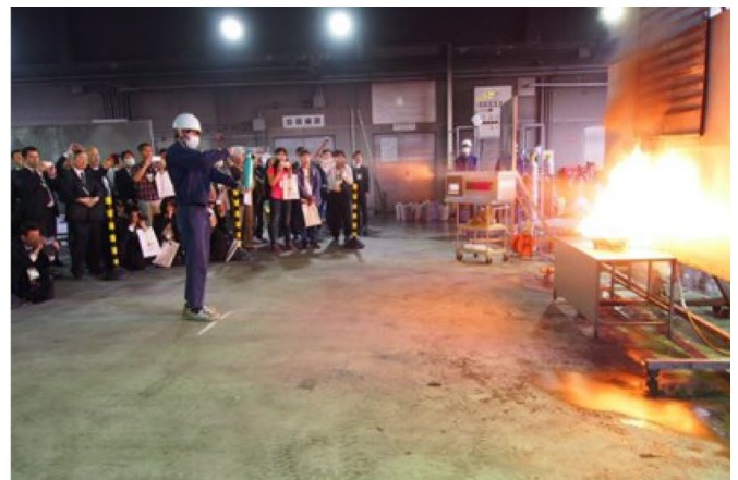
住宅用消火器による天ぷら油火災の消火実演 【日本消防検定協会】