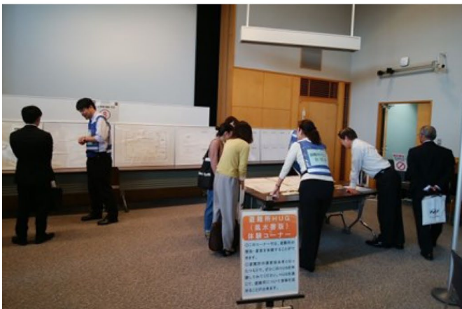
避難所HUG(風水害版) 【(一財) 消防防災科学センター】