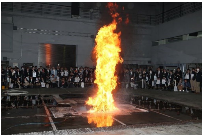
軽油の燃焼実験 【消防研究センター】