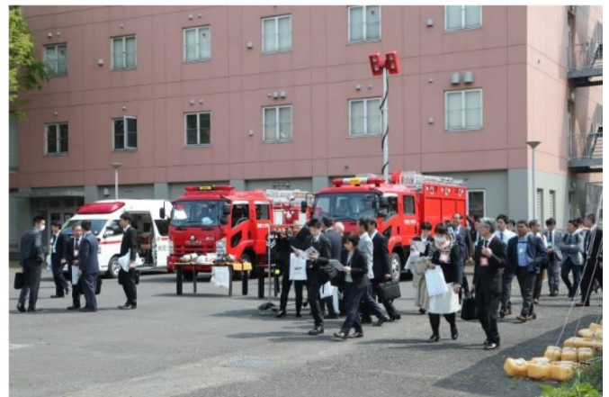
消防車両等の展示 【消防大学校】