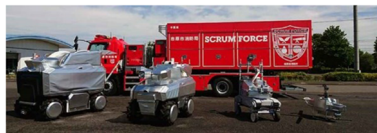
5. 無人自動放水消火ロボット（例）