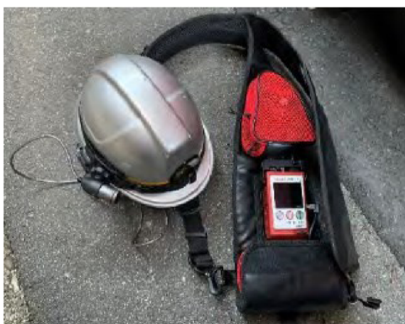
1. ウェアラブルカメラ（例）