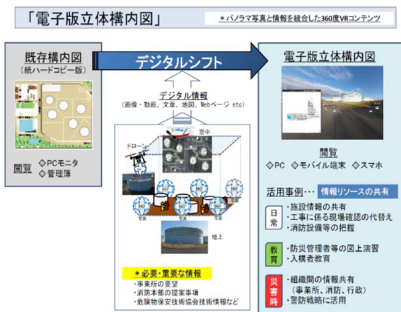
2. プラントのデジタル化