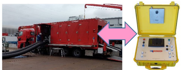
試験状況（送水ポンプ等とRCUの連携）