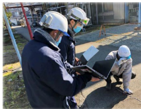
3. リモート査察等の実施