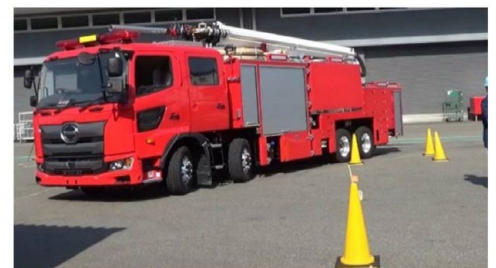
車両操作性の検証状況