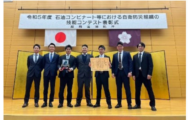
コンテスト出場隊員