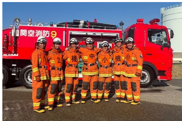
コンテスト出場隊員