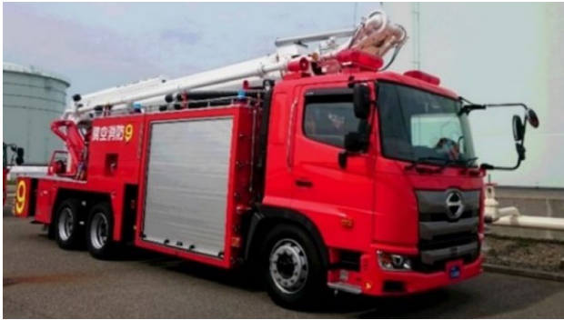
大型化学高所放水車