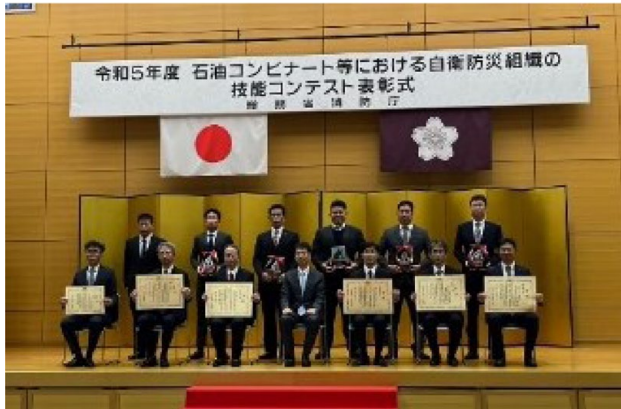
総務省消防庁 表彰式

令和5年12月8日(金)に中央合同庁舎二号館(総務省)において、総務大臣賞表彰式が開催されました。優秀賞を受賞した4組織および奨励賞を受賞した1組織とともに参加しました。