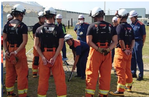
泉州南広域消防本部 訓練指導