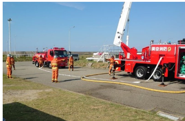
強化訓練実施状況