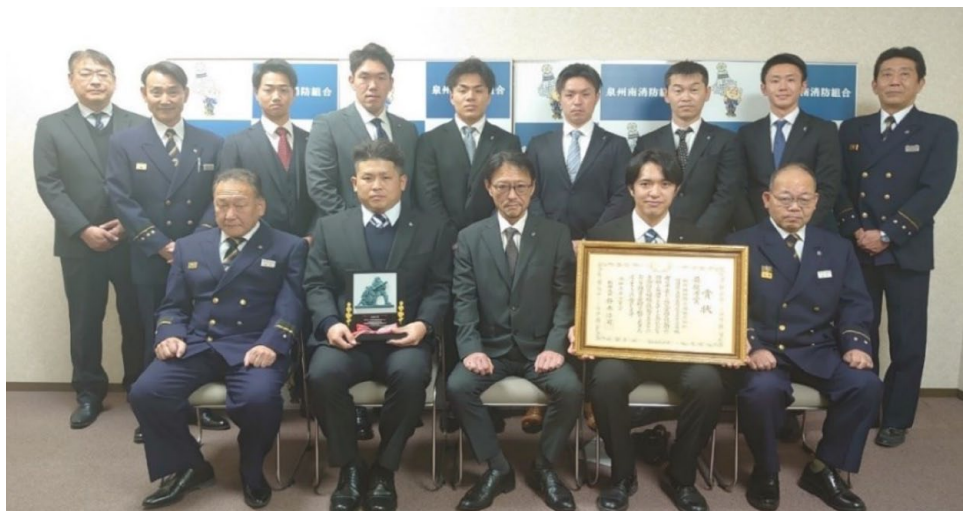
泉州南広域消防本部へ受賞報告時の記念撮影

結びに、技能コンテストに携わっていただいた皆様には多大なるご支援ご協力を頂戴しましたこと心より感謝申し上げます。