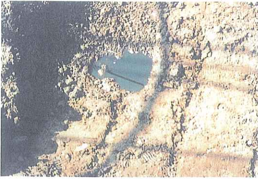
事故写真4 腐食した埋設配管からの漏れ (深さ約30cmのところ、重油約1.5ℓを回収。)

に伴い、強化プラスチック製配管の設置を検討したが、所有者は、金属製配管による設置を希望。