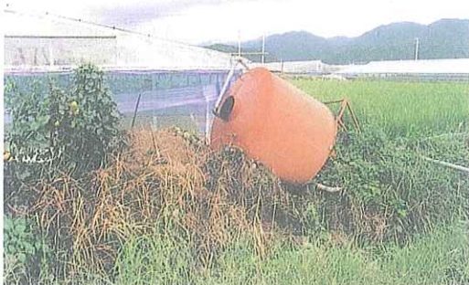
事故写真1 タンク重量により転倒した事例（設置面の地盤が整備されておらず、転倒防止策もとられていなかった。）

タンク設置部は田の中であるため、地盤が軟らかく、雨水等の水分を含むと更に軟弱化し、タンク及び重油の重量による地盤面の不等沈下、崩落が発生、これによりタンクの傾斜・転倒が起きる。通常、脚設置部の地盤をコンクリート、碎石等で硬化・補強しボルト等で固定するが、事故の起きた3基のタンクはこれを怠っていた。