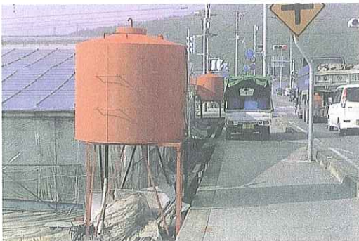
写真1 タンク設置例

給油の容易さ、施設の形状等により、大半の施設で、このように道路に接した位置に設置される。