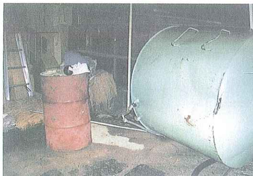
事故写真2 車輛の接触によりタンクが転倒した事例（道路にはみ出して設置し、転倒防止策もとられていなかった。）

車輛の接触・衝突によるタンクの破損・転倒事故は、車輛の運転者だけでなく設置位置にも問題があったと思われる。通常、タンクは給油配送車が容易に接近、給油できるよう道路に接した位置に設置するが、