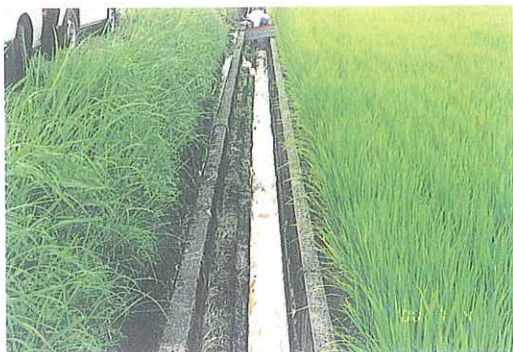
事故写真3-2 (排水路に流れた重油を、油処理剤にて処理中。)