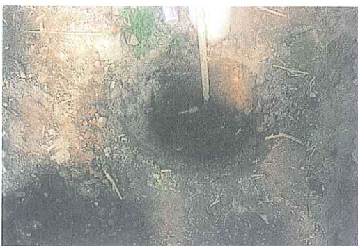
事故写真5 (塩化ビニール製パイプを埋設使用。 埋設部の継ぎ目部分から漏れがみられる。)

その上部を車輛、トラクター等が頻繁に走行したために起きたとみられる、ひび割れ、変形が2～3箇所あり、この部分から漏れが確認された。また、継ぎ目部分からも若干の漏れがみられた。